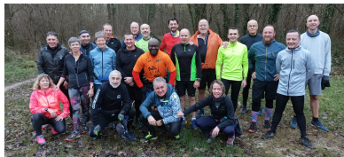
Bois Notre Dame 22 personnes