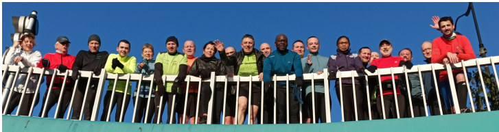
Bois Notre Dame 22 personnes