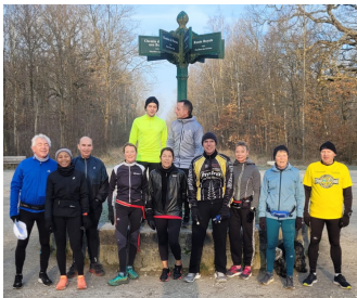
Bois Notre Dame 12 personnes