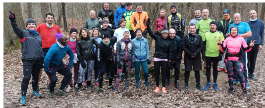
Bois Notre Dame 30 personnes