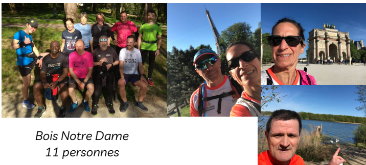
Bois Notre Dame 11 personnes