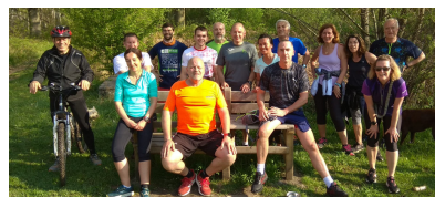
Bois Notre Dame 16 personnes