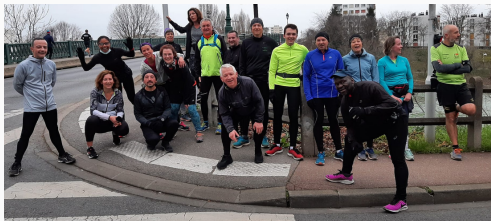
Bois Notre Dame 19 personnes