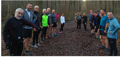
Bois Notre Dame 18 personnes