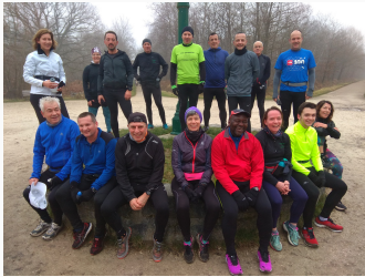
Bois Notre Dame 20 personnes