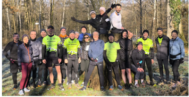
Forêt Notre Dame 20 personnes