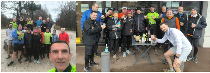
Forêt Notre Dame 17 personnes