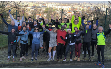
Bords de Marne 23 personnes