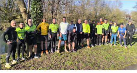
Bords de Marne 18 personnes