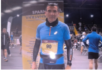
Raf en 3h00 → RP