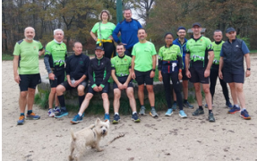
Forêt Notre Dame 14 personnes