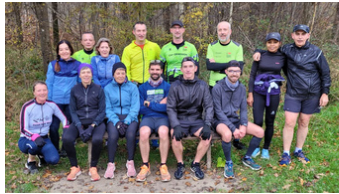
Forêt Notre Dame 14 personnes