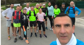
Bords de Marne 15 personnes