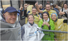
Guyone en 3h41 → RP Hervé en 3h58