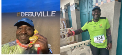
William en 1h56 → RP