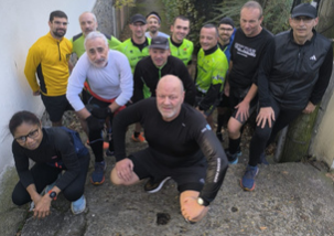
Bords de Marne 14 personnes