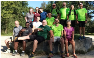
Bois Notre Dame 15 personnes