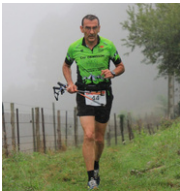
Raf en 3h36