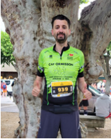
Ludo en 2h44