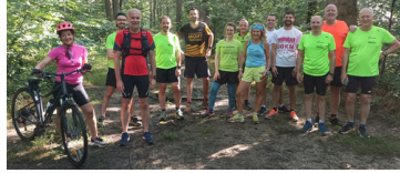
Bois Notre Dame 14 personnes