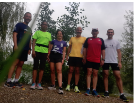
Bords de Marne 8 personnes