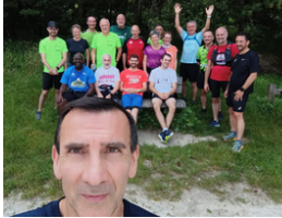
Bois Notre Dame 18 personnes