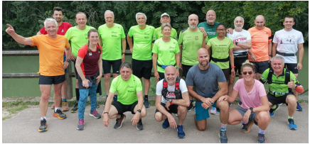
Bords de Marne 20 personnes