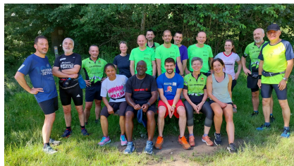
Bois Notre Dame 18 personnes