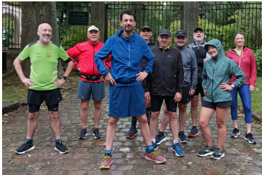
Sortie Mixte (Ville & Bois) 10 personnes