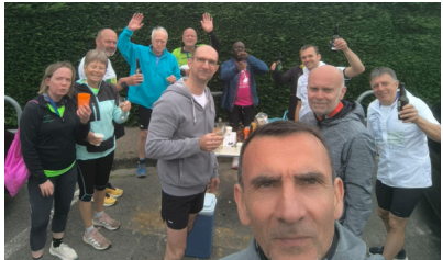
Challenge SOM des forêts